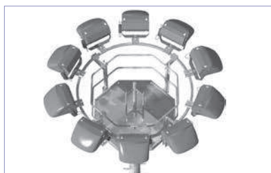
PFC 15/12 avec 10 projecteurs portés à 360 °