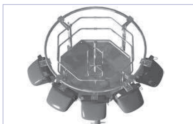
PFC 15/12 avec 5 projecteurs suspendus sur une face