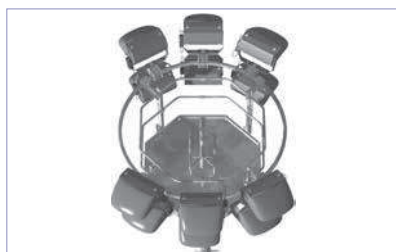
PFC 15/12 avec 6 projecteurs portés et 6 suspendus - sur 2 faces