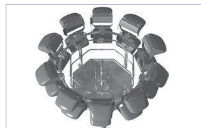
PFC 15/12 avec 10 projecteurs portés et 10 suspendus - à 360 °