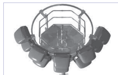
PFC 15/12 avec 5 projecteurs portés et 5 suspendus - sur une face